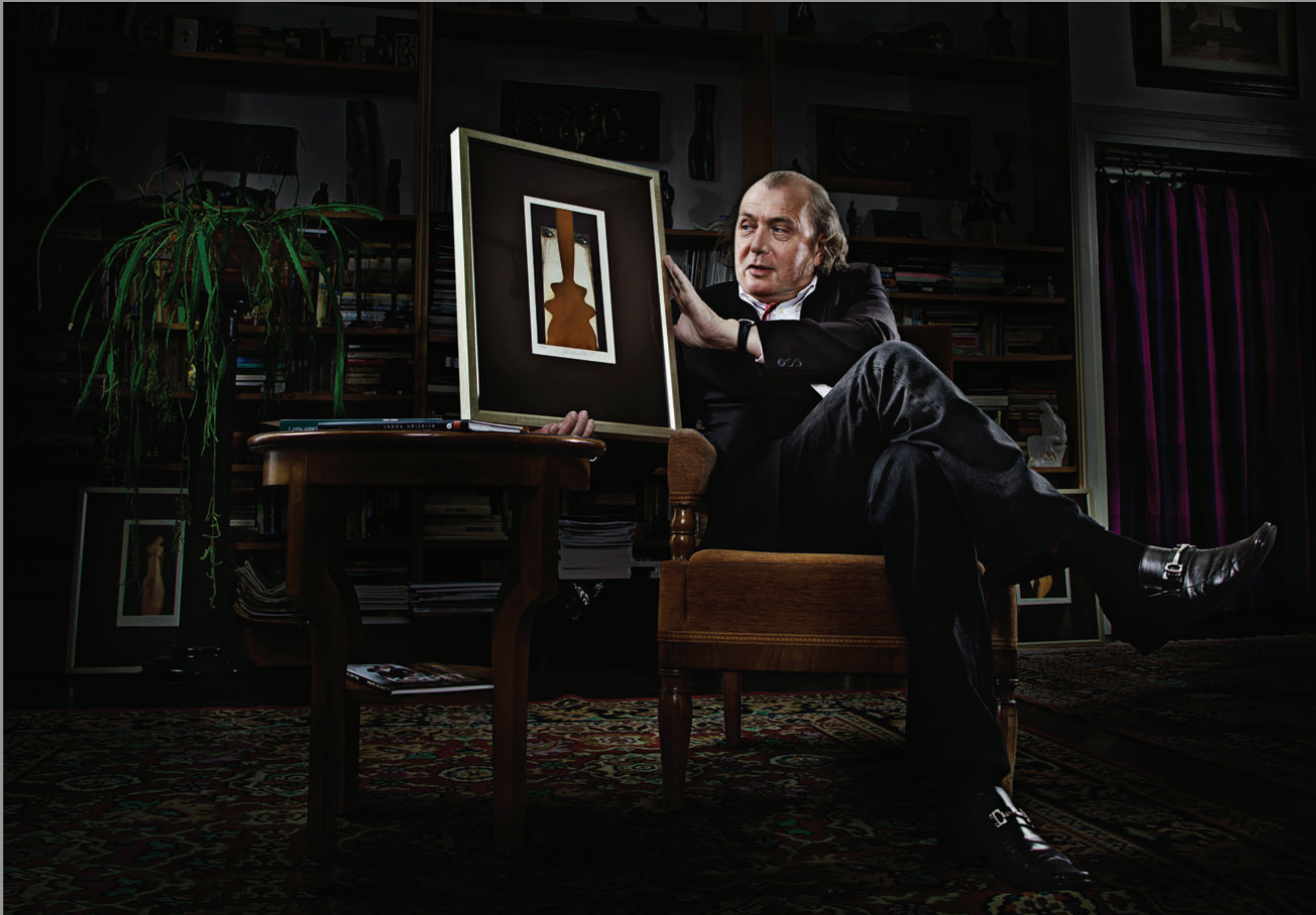
Daroval – grafika „Zrcadlení“