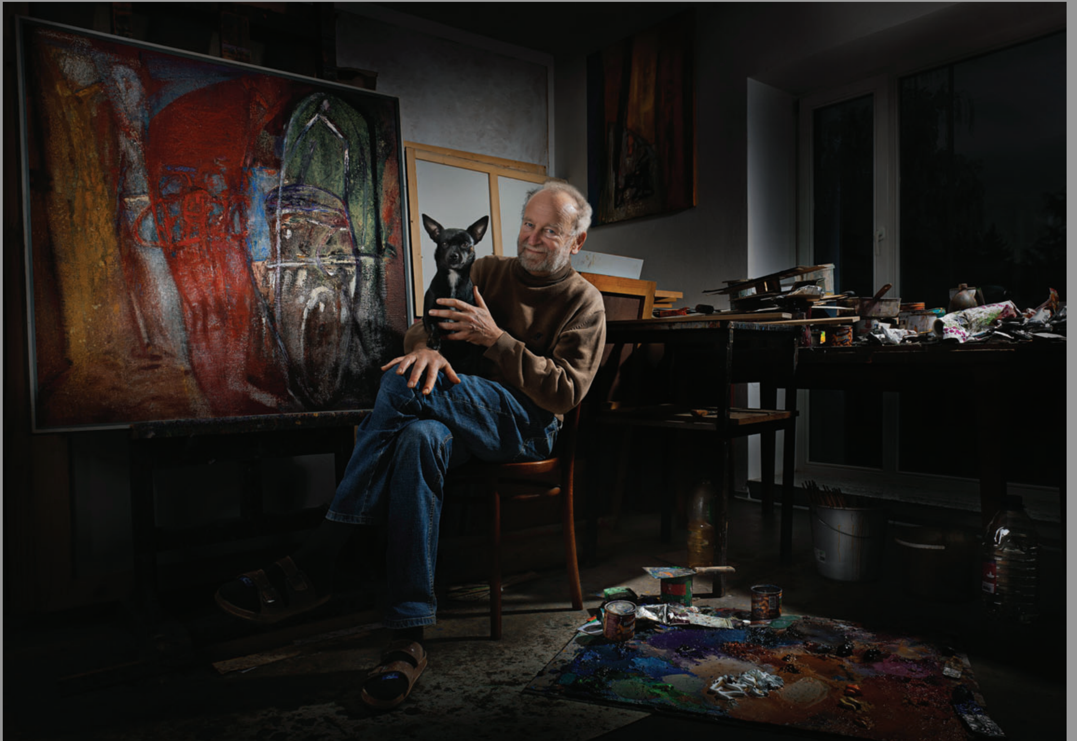
Daroval – olej, pigment, plátno „Divadelní scéna“ 1998