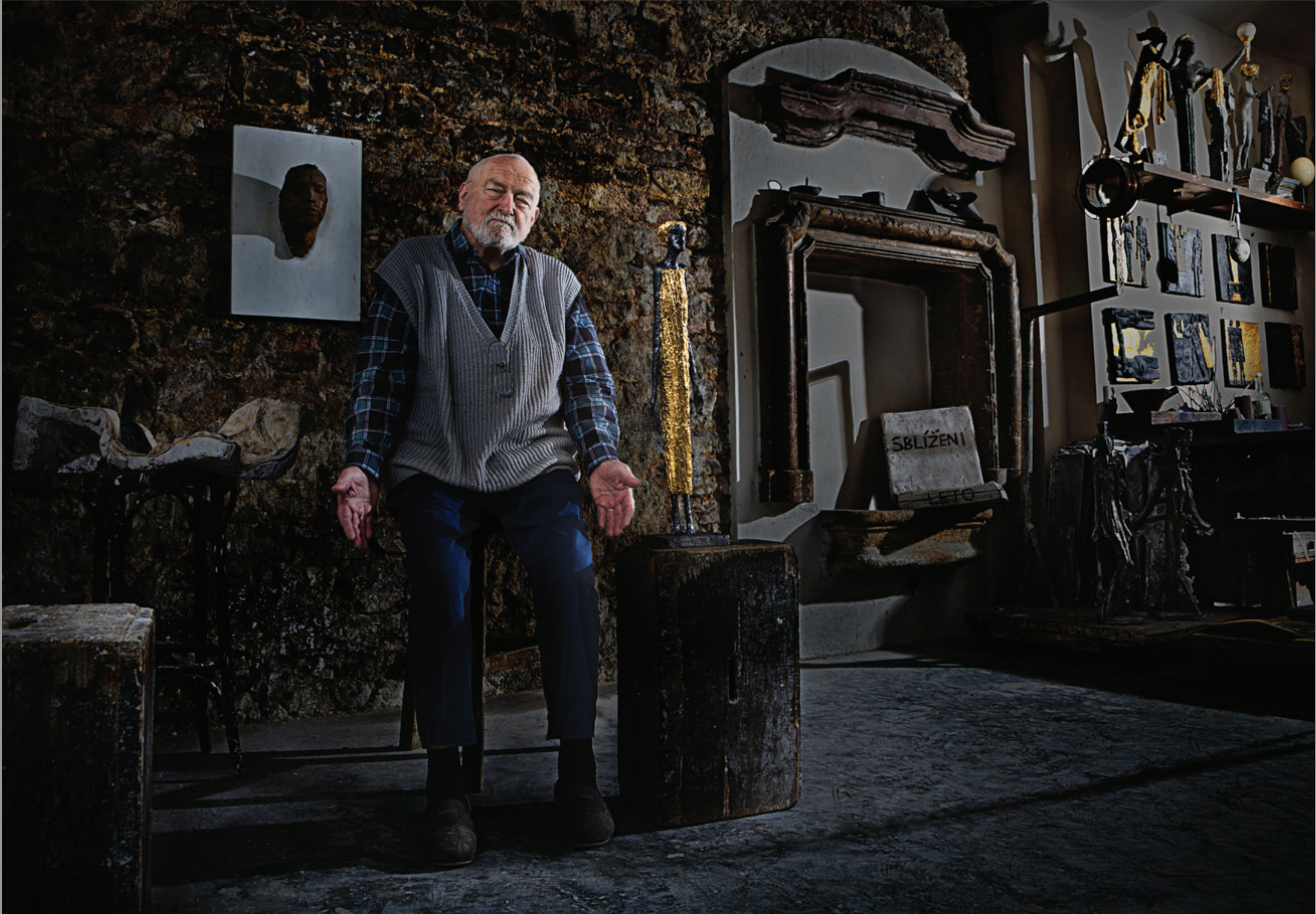
Daroval – plastika „Evo“