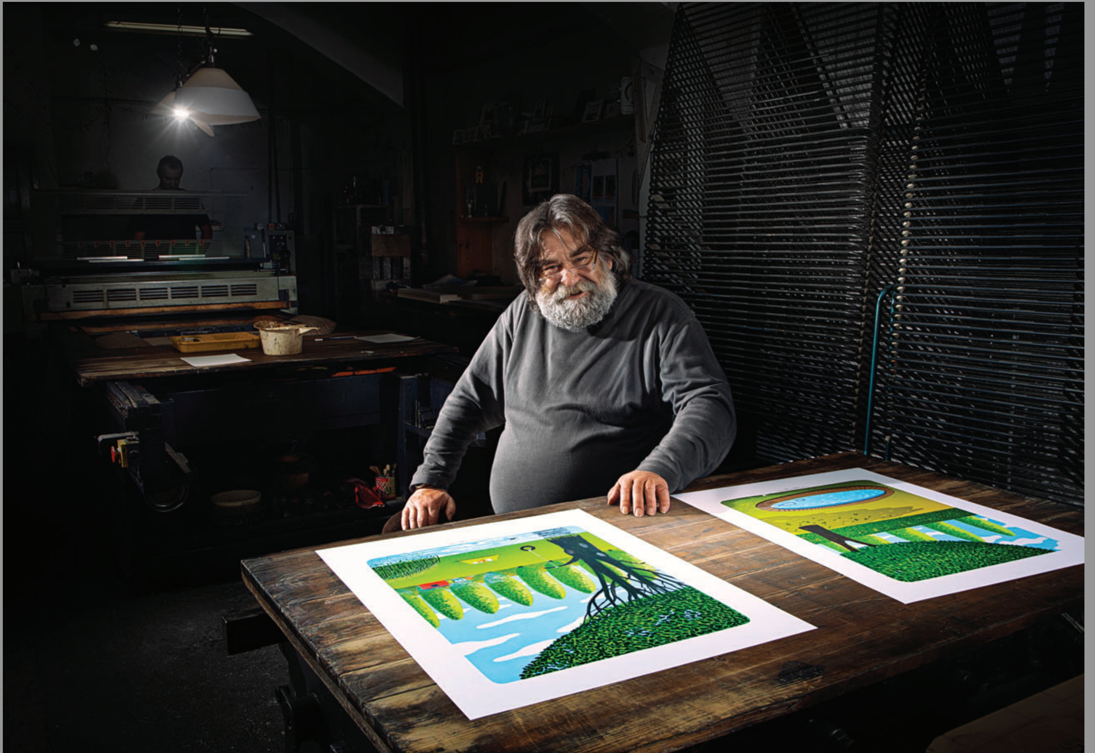
Daroval – litografie „Bazén“ a „U řeky“