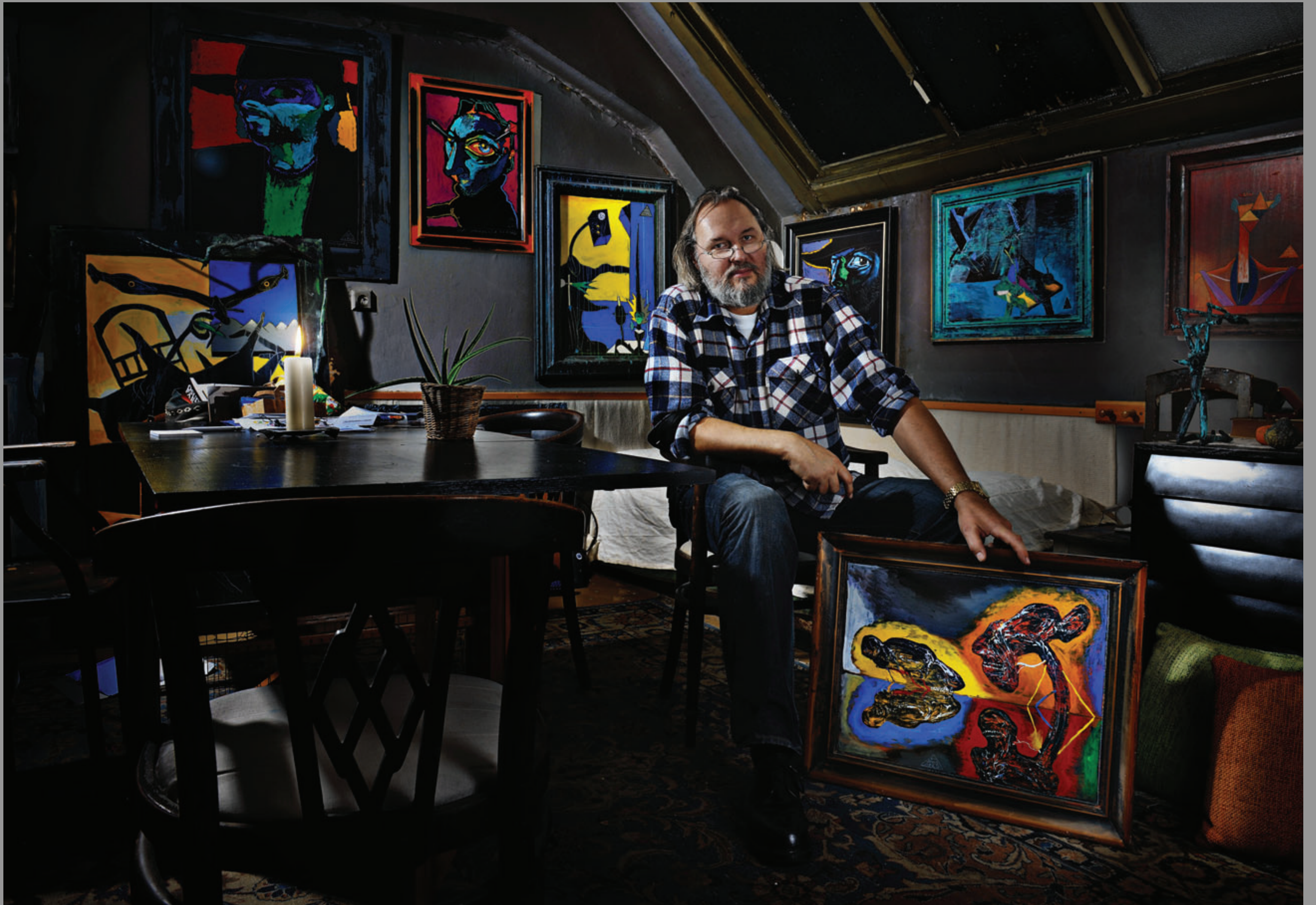
Daroval – kombinovaná technika „Co je nahoře, je i dole. Co je dole, je i nahoře“