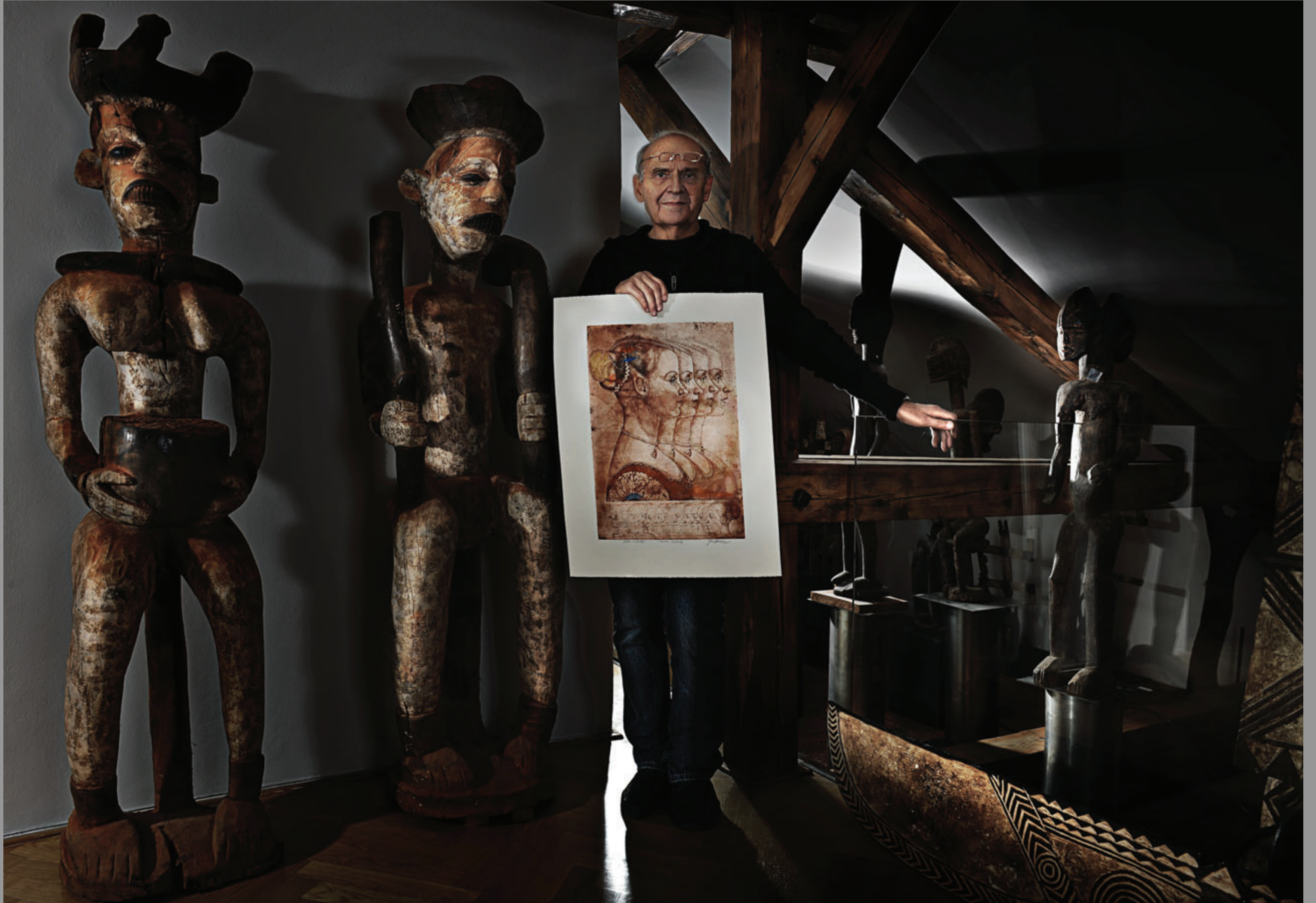
Daroval – lept kombinovaný s barevnou kresbou, unikát číslovaný 1/1 „Kráska z Benátek“ 2000