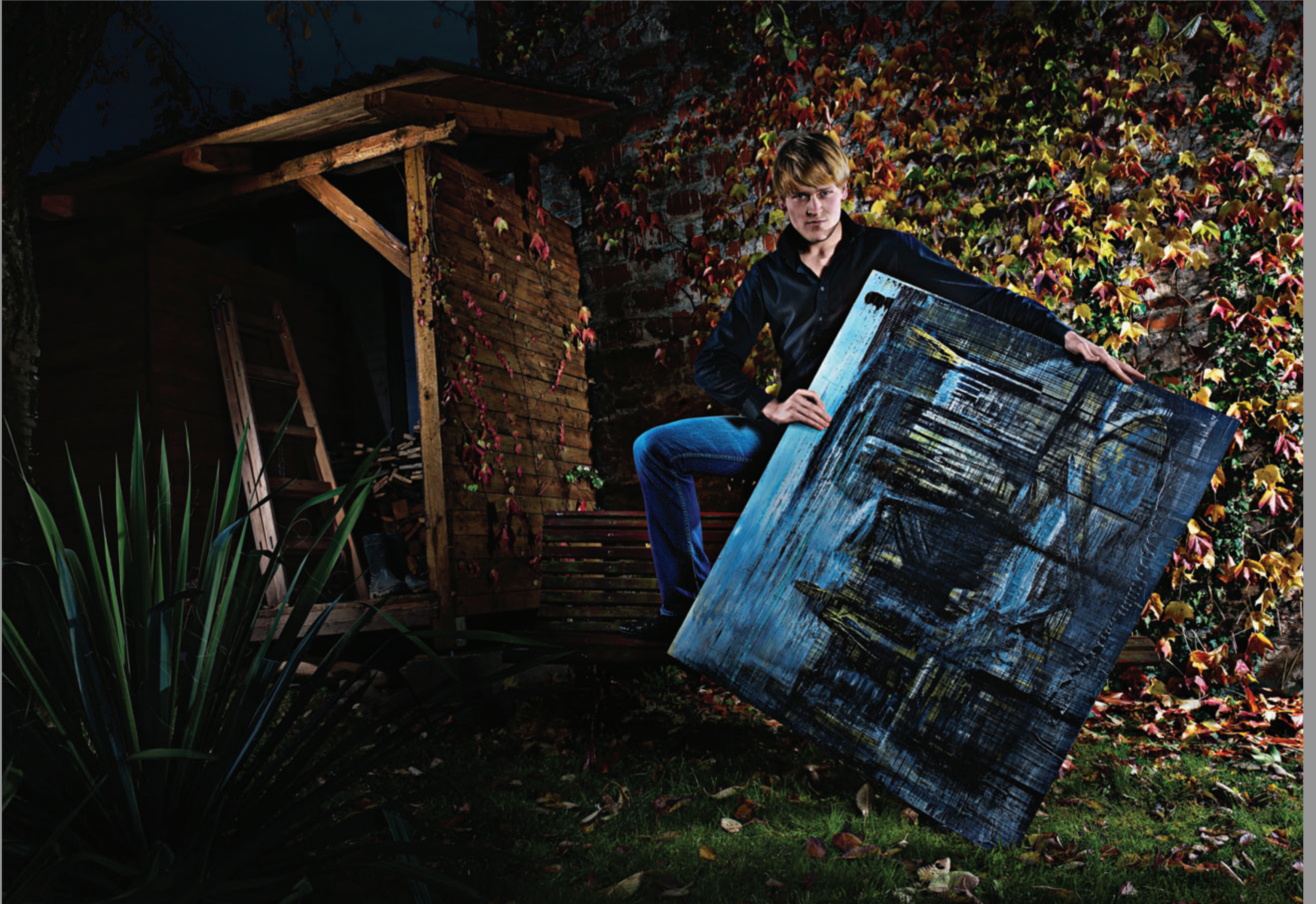
Daroval – akryl na sololitu „Město“ 2008

Lighting system by PMEL