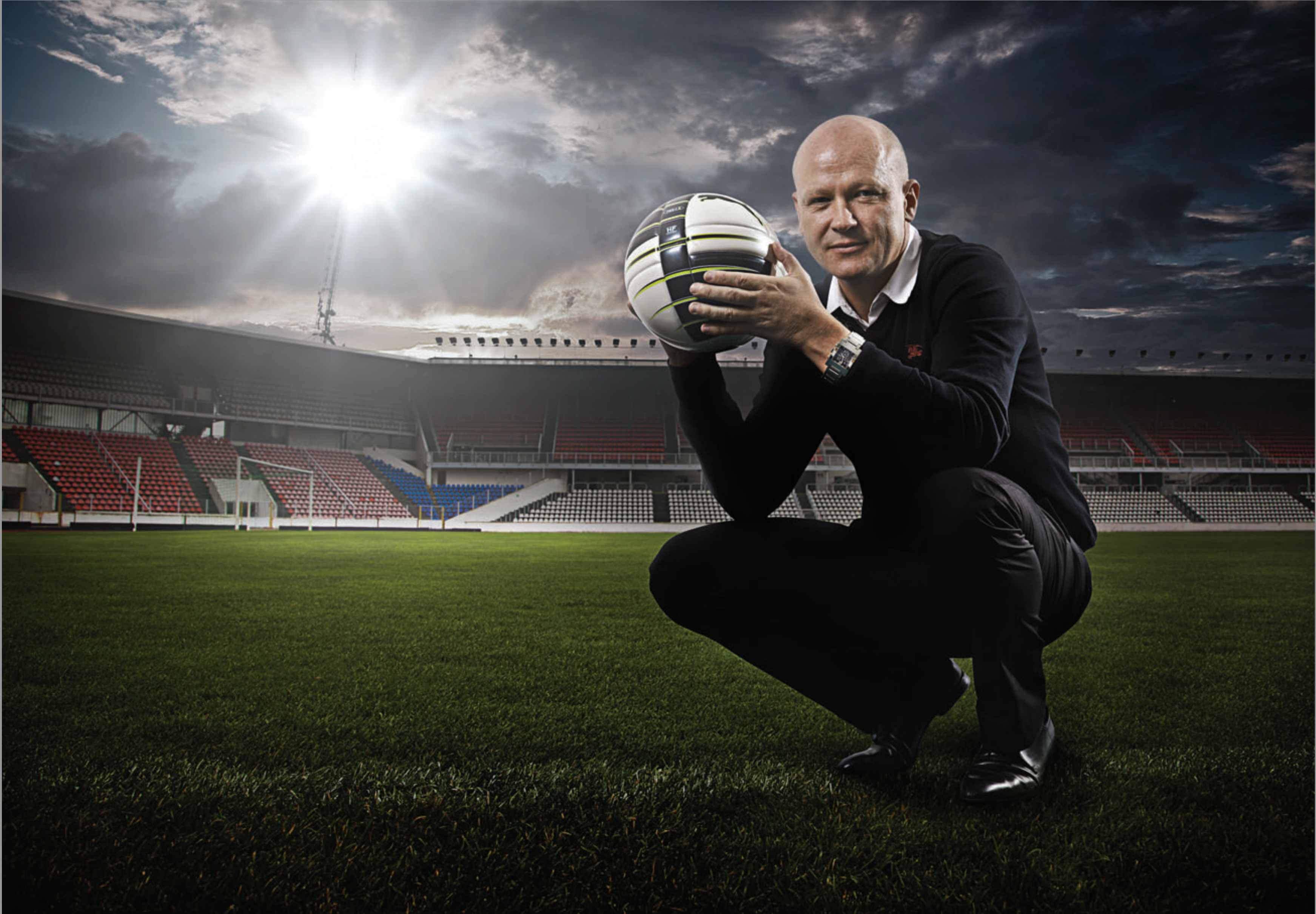
Daroval – hodinky „Gucci“ – Mistr ligy 2000