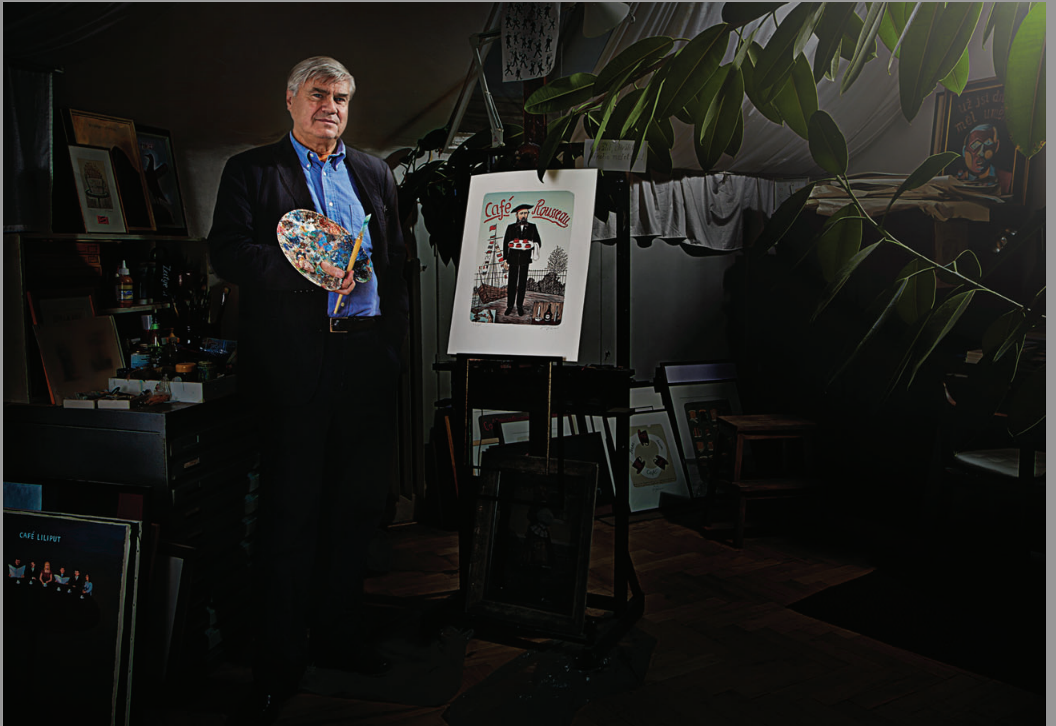
Daroval – litografie „Café Rousseau“

Lighting system by ROMEL