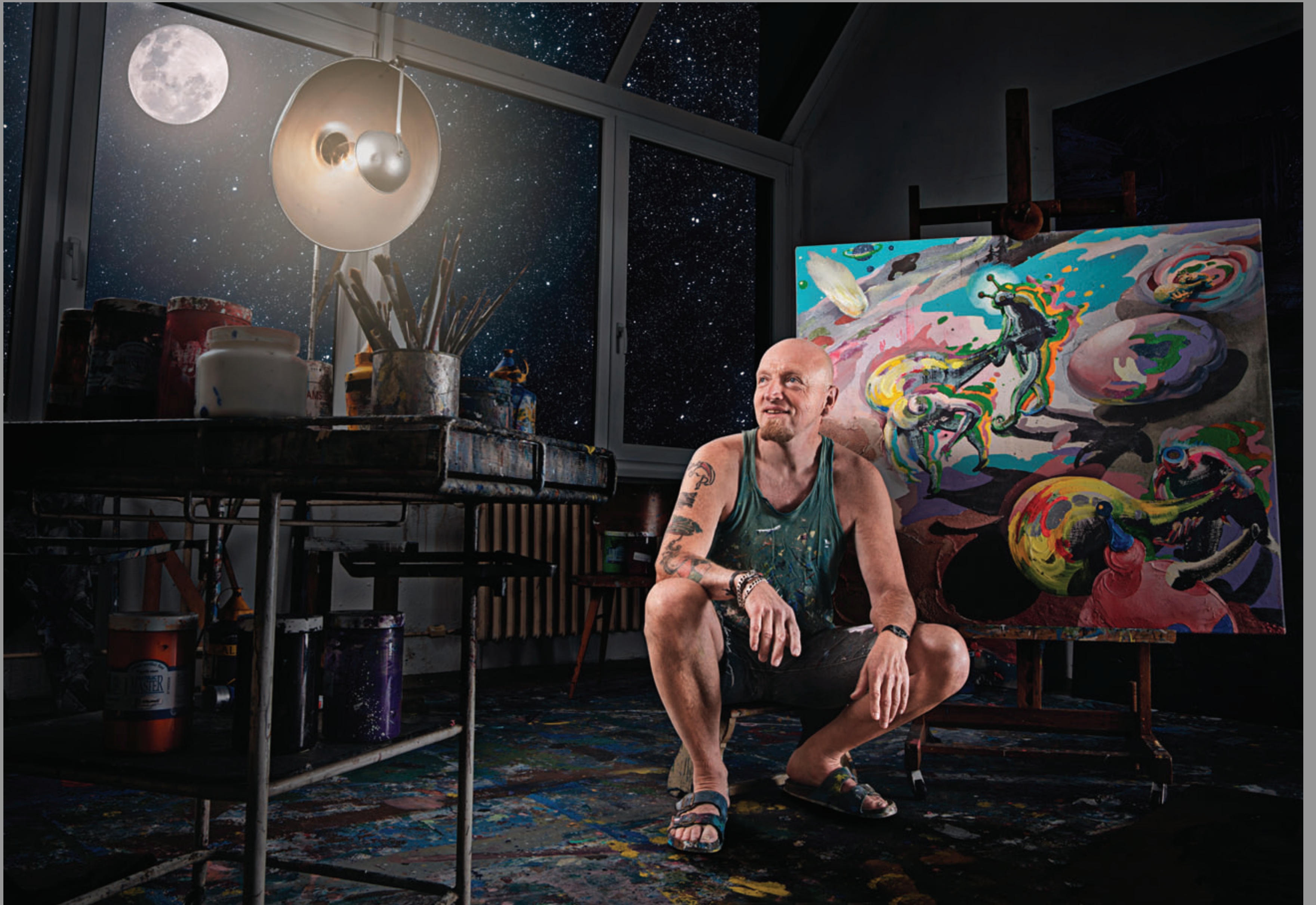
Daroval – akryl na plátně „Marfani s kyji“

Lighting system by ROMEL